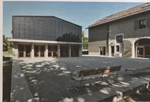
9 Le théâtre reprend le langage de l'ancien bâtiment d'exploitation.