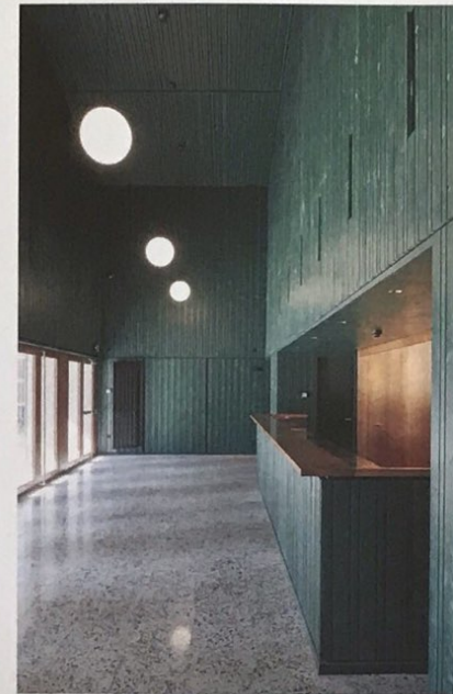
9 Le foyer se déploie jusqu'au pignon.

Ce volume compact, coiffé d'un toit à deux pans faiblement inclinés, reprend la typologie de l'ancien bâtiment d'exploitation et sert de laboratoire à l'art dramatique contemporain. Couleurs, matériaux et construction contrastent ici avec les murs au crépi clair de la ferme. Le bardage des façades à ossature bois est rythmé par une trame de nervures en saillie; les portes et les rares fenêtres en bois naturel font écho à celles de la ferme. À l'intérieur, le foyer, revêtu de panneaux