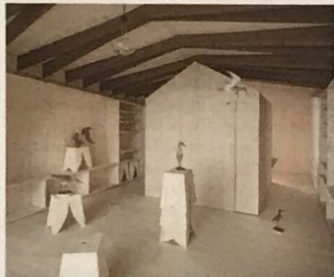
8 Les tabourets sont aussi l'œuvre des architectes.