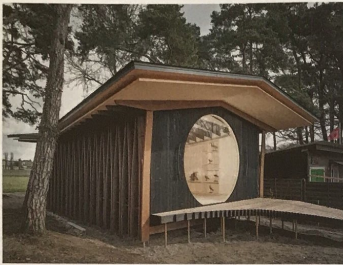
8 Le pavillon évoque une cabane à oiseaux.