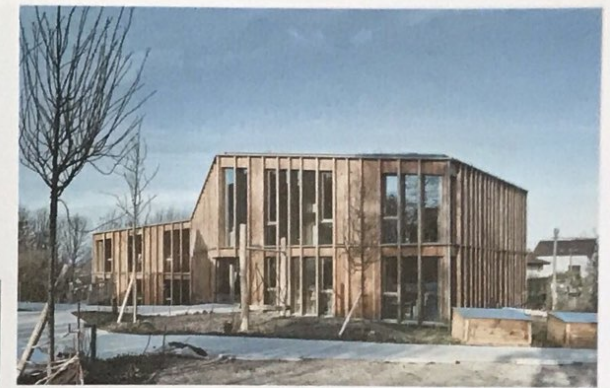
10 Les façades de la nouvelle crèche de Renens se composent de mélèze et d'épicéa.

Le Grand-Saconnex (GE) Maître de l'ouvrage: Ville du Grand-Saconnex Architecture: Association de bureaux Calanchini Greub Architectes, Genève; Nazario Branca Architectes, Lausanne Ingénieur: ESM Ingénierie, Genève Exécution des travaux en bois: Consortium Ateliers Casai, Petit-Lancy; Duret, Thônex Bois principalement mis en œuvre: Épicéa, peinture couvrante